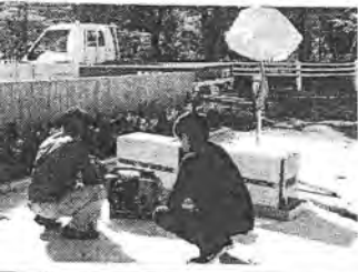
関係者に低圧LPガス発電機の使用方法を説明する矢崎エンジニアシステム担当者