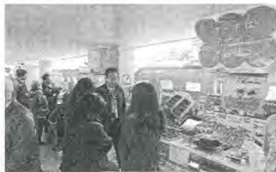
展示特価でガス機器の販売につなげる

たが、急なお酒の接待におつまみがない。困った主婦が即席で冷蔵庫にある食材でガスコンロのグリルを使って鮭のホイル焼きを調理。上司が手際の良いと味の良さに感心するというストーリー。わかりやすい芝居で笑いを誘いながら、出来上がった鮭のホイル焼きの試食も行い、感想として「簡単にできて、おいしい」と好評で拍手喝采で終了した。